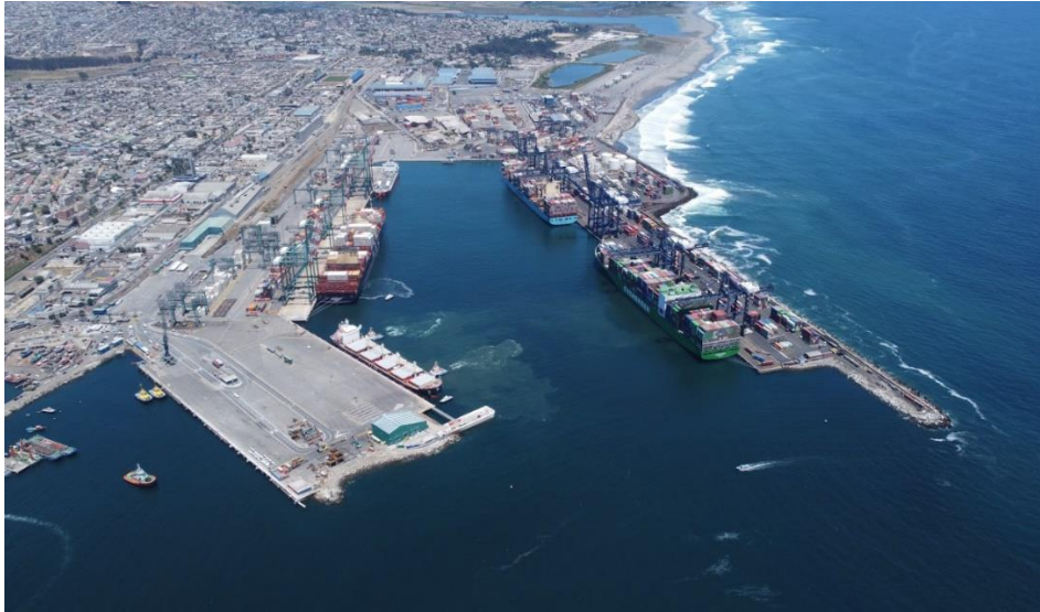
Ilustración 1: Puerto San Antonio.

El alcance del estudio es el desarrollo de una serie de estudios y actividades de terreno, tendientes a conocer y monitorear las variables oceanográficas de mayor incidencia operativa del puerto actual. Lo anterior deberá permitir optimizar de mejor forma la gestión de las operaciones de Puerto San Antonio.